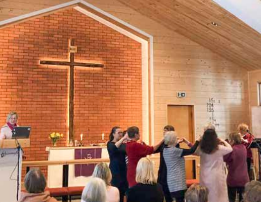
Naistenpäivien messun ylistyslaulu, Sovituksen juhla alkaa nyt (israeliläinen)